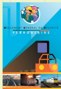
« Règlement Général de Sécurité ferroviaire »